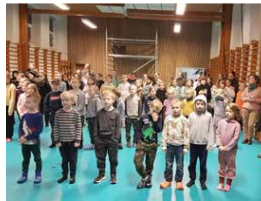
Fotos fra tidskapselens indhold og fejring på dagen.

En skøn uge hvor vi fejrede vores herlige skole. Hip hip Hurra.